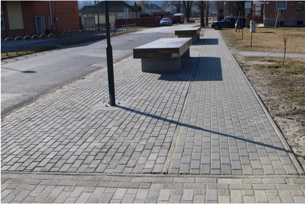
Harica u. (hrsz.: 776) Coop ABC és a Bükkalja utca közötti szakasza 245 m