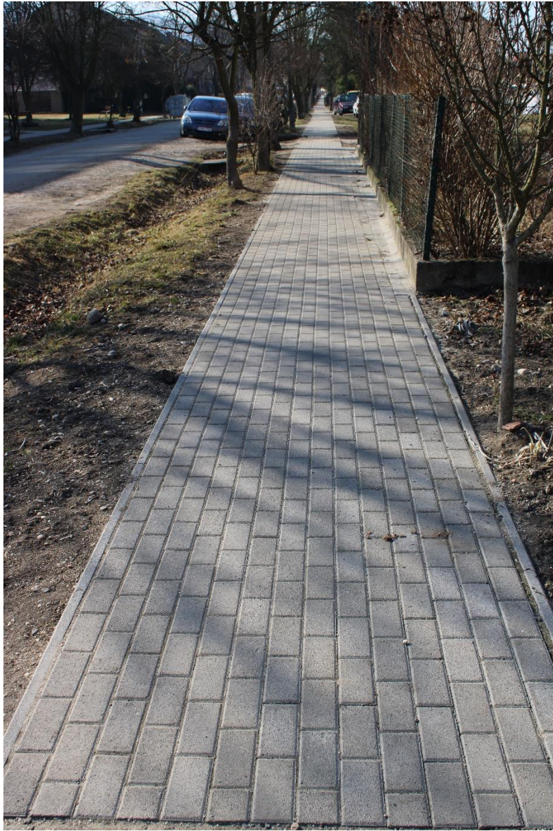
Bükkalja utca 1-12. (hrsz.: 817) kétoldali járdaburkolat felújítása 215 m