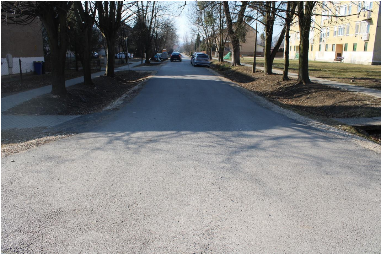
Bányász utca 1-14. (hrsz.: 832) útburkolat szélesítése és felújítása 220 méter