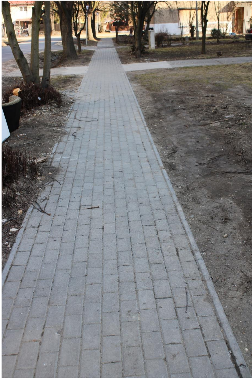
Bányász utca 1-2. (hrs.: 832) kétoldali járdaburkolat felújítása 75 m