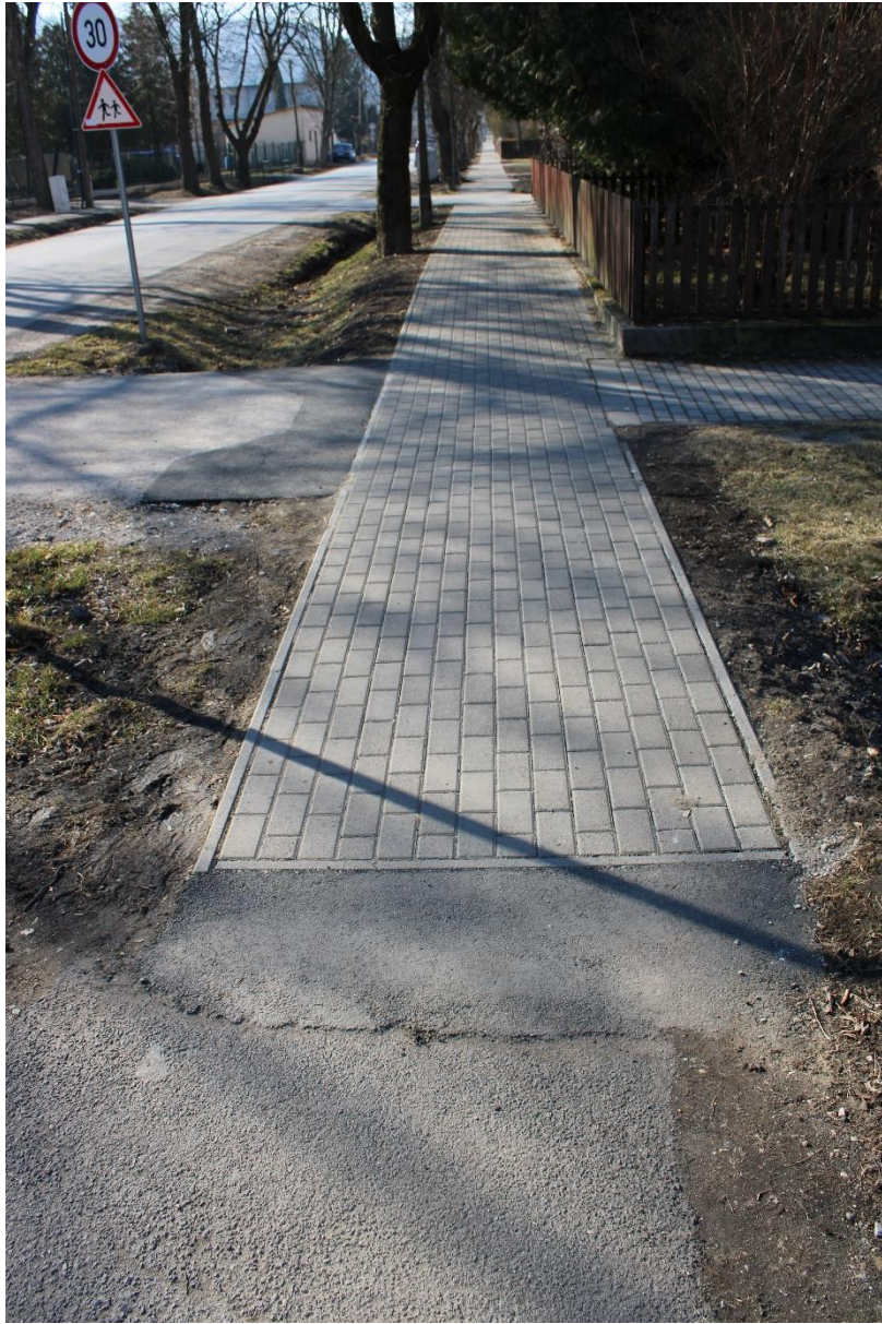
Harica utca 1/A-6. (hrsz.: 776) egyoldali járdaburkolat felújítása 184 m