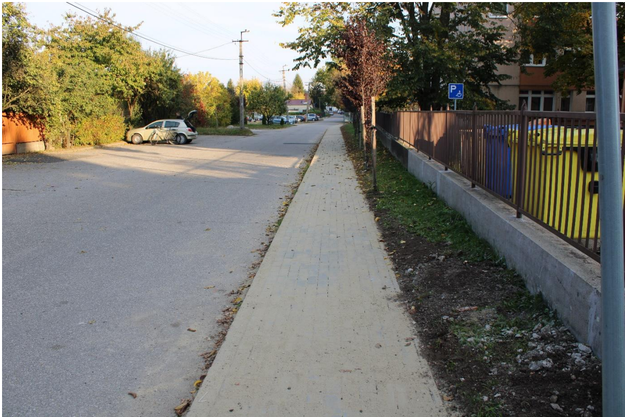
Semmelweis utca (Kossuth Lajos út 195. szám mögötti járdaszakasz) (hrsz.:1709/55) járdaburkolat felújítása 100 méter