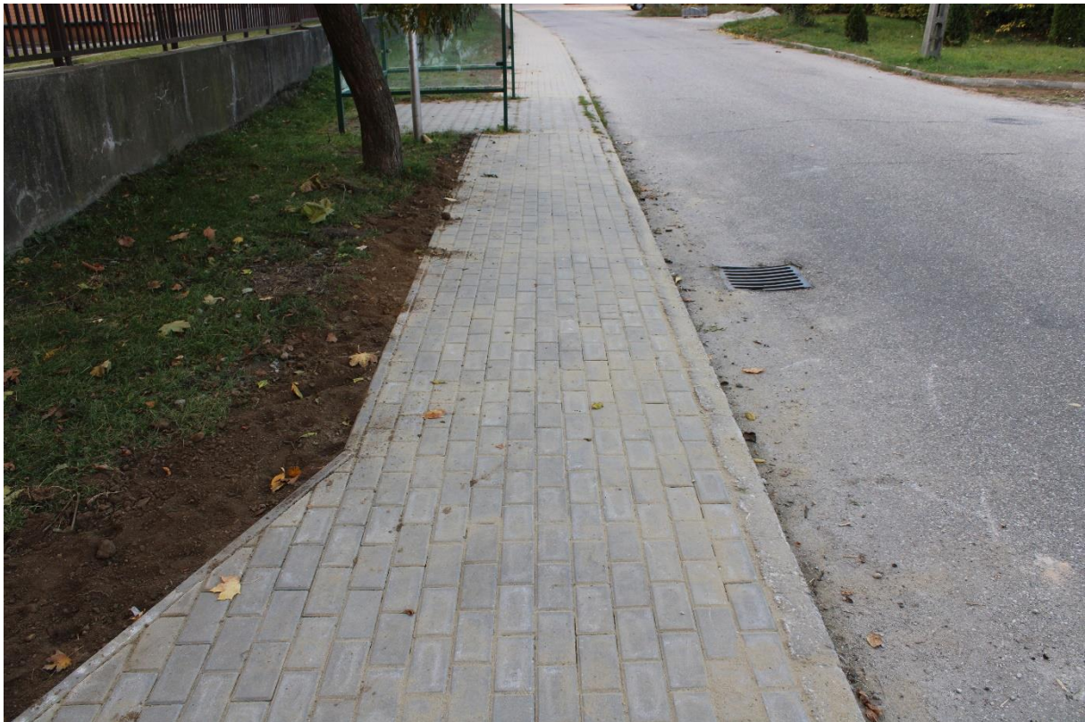
Semmelweis utca (Kossuth Lajos út 195. szám mögötti járdaszakasz) (hrsz.:1709/55) járda- és padkafelújítása 100 méter