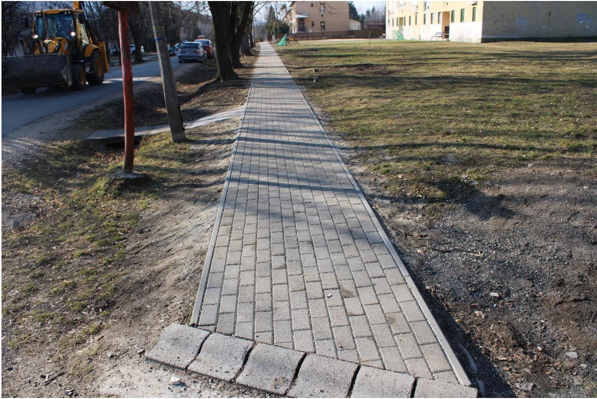
Bányász utca 1-2. (hrs.: 832) kétoldali járdaburkolat felújítása 75 m