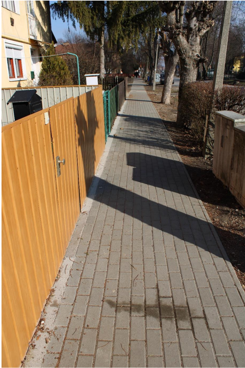
Harica utca 1/A-6. (hrsz.: 776) egyoldali járdaburkolat felújítása 184m