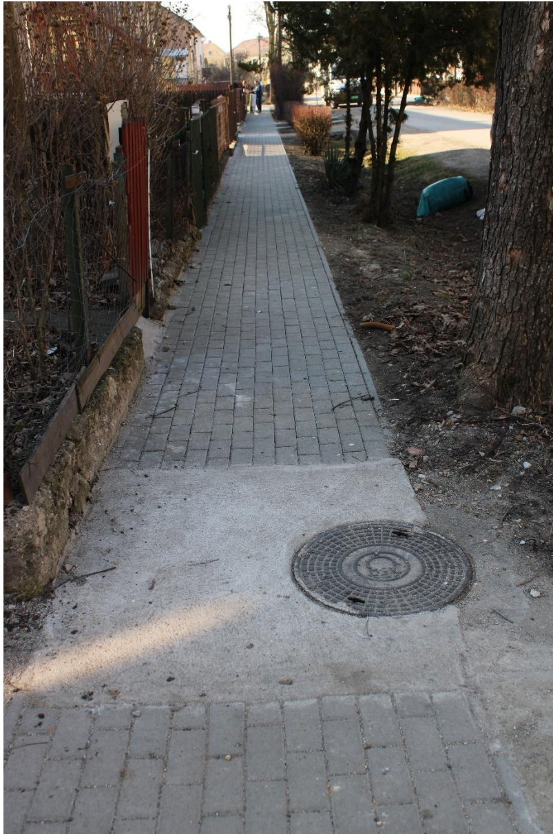
Bükkalja utca 1-12. (hrsz.: 817) kétoldali járdaburkolat felújítása 215 m